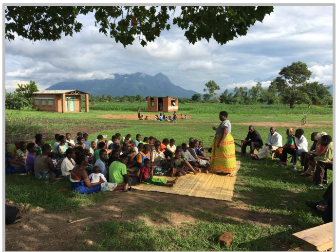
Ett av våra inspirationsmöten. Här har vi vår hedersgäst, "the PEA", chefen för alla grundskolor i distriktet. Bakom henne sitter rektorer, role models och hövdingar.

Efter att vi haft våra samtal med barnen bjöd vi in alla berörda familjer till stormöten, eller så kallade "inspirationsmöten", där vi fick chans att berätta mer om programmet och varför vi tycker att det är extremt viktigt för barnen att gå i skolan. Till mötena hade vi dessutom bjudit in rektorerna från de olika skolorna, samt byhövdingarna, och några elever från Mpsa Secondary School (som skulle representera "role models"), som alla ställde upp och höll fantastiska tal inför barnen och deras familjer. De inspirerade verkligen, inte minst eftersom nästan alla på ett eller annat sätt kunde relatera till hur de själva hade fått kämpa sig igenom skolgången.