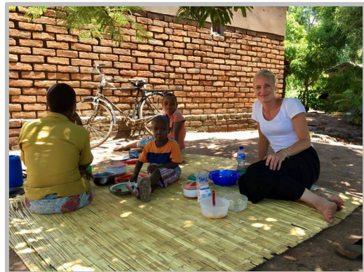
Härlig lunch i skuggan

Jag skulle kunna berätta hur mycket som helst om den lilla byn och hur det är att bo på det här sättet. För att inte gå in för mycket i detalj och tråka ut er, så kan jag bara säga med ett ord att det är fantastiskt . Att bo så nära naturen, långt bort från bilarnas buller, avgaser, elektricitet, stressen... Facebook, Instagram, Snapchat finns inte så långt ögat kan nå... det är avkopplande. Man är i nuet , man är närvarande på ett sätt som jag sällan är hemma i Sverige. Man har tid att tänka. Och bara det här att kunna äta sådant som de odlar på sin egen tomt, hur mycket mer närproducerat kan det bli? Man känner sig så nära naturen på alla plan, man känner sig sund och mår bra (att det är svettigt, varmt, och mycket mygg om kvällarna har jag redan förträngt, men det är ju sådant man får räkna med när man åker till Afrikat ☺).