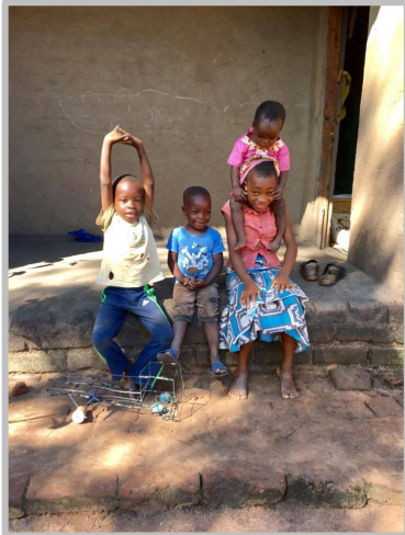
Några av barnen i familjen <3