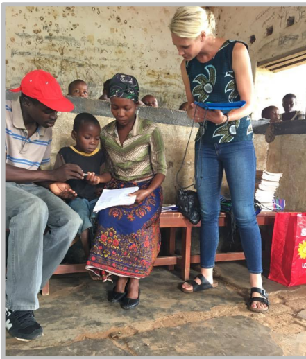
Här har vi utdelning av skol-startkitet, barnen får skriva under på att de vill vara med i programmet och gå tillbaka till skolan.

Personligen tyckte jag att dessa möten var helt fantastiska. Mitt i allt allvar så låg det ändå mycket optimism i luften, och det kändes som att alla verkligen uppskattade att få samlas och samtala om problemen. Mötena avslutades med sång och drama, och de fick information om på vilket sätt vi från Afrogarden kunde stötta dem om de var villiga att återvända till skolan.